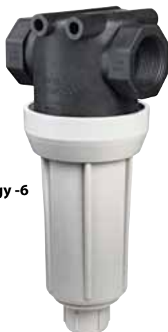
AA126ML-5 vagy -6