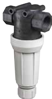
AA126ML-3 vagy -4