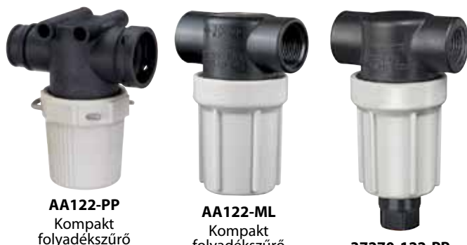
AA122-PP Kompakt folyadékszűrő