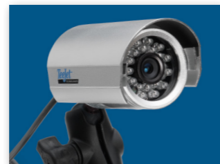
STÖDJER UPP TILL 8 KAMEROR