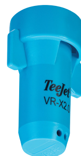
ROZPYLACZ WIELOOTWOROWY SJ7A-VR-X2.0