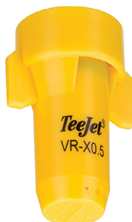
ROZPYLACZ WIELOOTWOROWY SJ7A-VR-X0.5