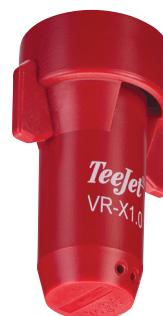
ROZPYLACZ WIELOOTWOROWY SJ7A-VR-X1.0