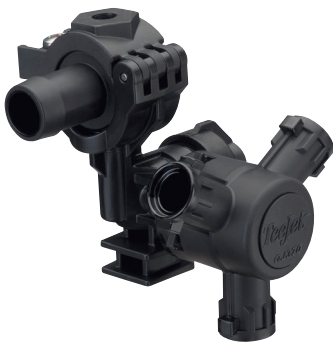
Corps de buse QJ373