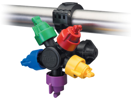
Corps de buse QJ375