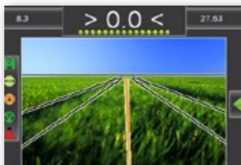
REALVIEW НАВИГАЦИЯ ПОВЕРХ ВИДЕО