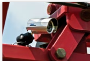
КАМЕРЫ REALVIEW® МОГУТ БЫТЬ ЛЕГКО УСТАНОВЛЕНЫ В ЛЮБОМ УДОБНОМ МЕСТЕ