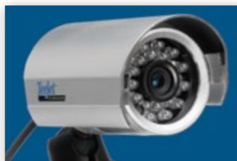
ПОДДЕРЖИВАЕТСЯ ДО 8 КАМЕР