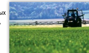
СОВМЕСТИМ БОЛЕЕ ЧЕМ С 800 МОДЕЛЯМИ ТРАКТОРОВ, ОПРЫСКИВАТЕЛЕЙ И КОМБАЙНОВ

Каждый набор FieldPilot Pro включает все необходимые для установки кронштейны, фитинги и крепления именно на вашу технику. Доступно более 150 специально созданных комплектов FieldPilot Pro, что делает его совместимым более чем с 800 моделями тракторов, опрыскивателей и комбайнов.