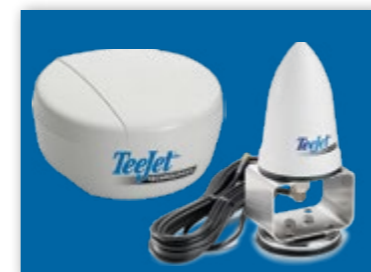
ПРИЕМНИК RX520, АНТЕННА RXA-30

FieldPilot Pro готов к работе с любым уровнем точности GNSS сигнала. Более высокий уровень точности GNSS сигнала бесспорно увеличит точность вождения. Тем не менее, стабильность и надежность вождения достигается и на стандартном сигнале GPS и GLONASS. Выберите уровень точности сигнала, необходимого для ваших операций, а FieldPilot Pro проконтролирует точность навигации.