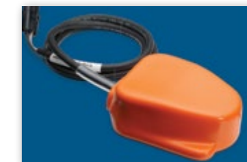
ОПЦИЯ ПЕДАЛЬ (МОЖНО ЗАКАЗАТЬ ОТДЕЛЬНО)

Опционально можно установить педаль к FieldPilot Pro для еще более комфортной работы. Это позволит освободить руки время вождения и оперативно перейти на ручное управление при поворотах. Автоматическое подруливание сразу же отключается, как только оператор поворачивает рулевое колесо.