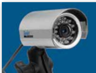
MOŻE OBSŁUŻYĆ DO OŚMIU KAMER