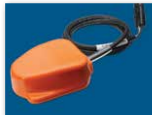
PRZEŁĄCZNIK PODŁOGOWY – W ZESTAWIE