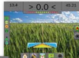
NAWIGACJA Z PODGLĄDEM VIDEO

Podgląd video pozwala monitorować zabiegi podczas gdy UniPilot Pro steruje pojazdem. Na końcu pola wyświetlany obraz video pomaga z łatwością dokończyć manewr na uwrociu.