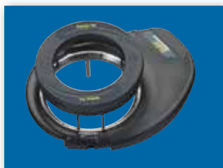
ELEKTRYCZNY NAPĘD STEROWANIA

Dowiedz się więcej o UniPilot Pro oraz nawigatorach Matrix Pro GS i odwiedź stronę www.teejet.com