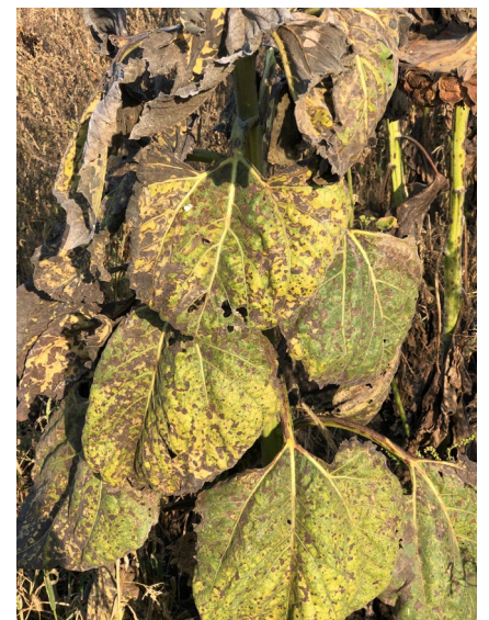
Примеры некачественной десикации крупноплодного подсолнечника, Краснодарский край