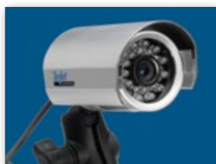
ПОДДЕРЖИВАЕТСЯ ДО 8 КАМЕР