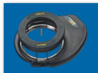
ЭЛЕКТРИЧЕСКОЕ ПОДРУЛИВАЮЩЕЕ УСТРОЙСТВО

Узнайте больше о UniPilot Pro и навигаторе Matrix на сайте www.teejet.com