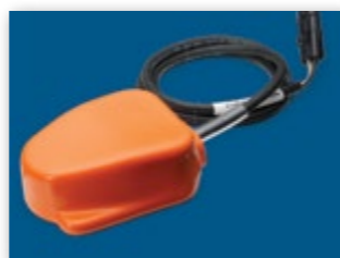
ОПЦИЯ ПЕДАЛЬ (МОЖНО ЗАКАЗАТЬ ОТДЕЛЬНО)