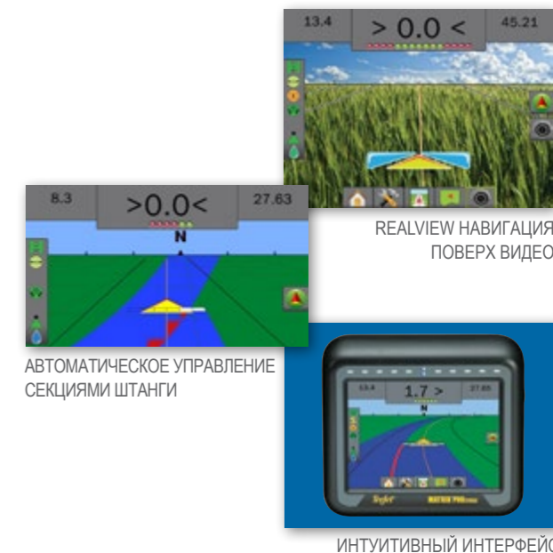
АВТОМАТИЧЕСКОЕ УПРАВЛЕНИЕ СЕКЦИЯМИ ШТАНГИ

RealView позволит вам контролировать работу орудия, в то время как UniPilot Pro займется подруливанием. Изображение с камеры позволит с легкостью совершить точный поворот в конце ряда.